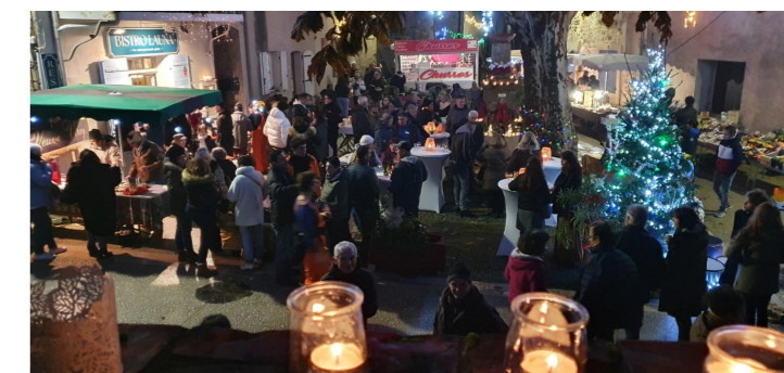
Bonne ambiance sur la place pour la fête des lumières