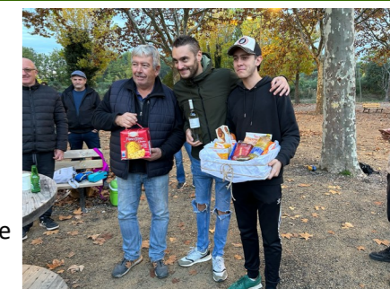
Les gagnants du 12 novembre