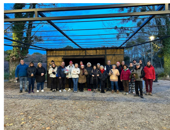
Les participants venu nombreux le 10 décembre

Elle organise aussi en collaboration avec le PAF (Peypin d'Aigues Festivités), des journées à thèmes comme la fête des Lumières avec son petit marché de Noël. ( qui s'est déroulée le 8 décembre )