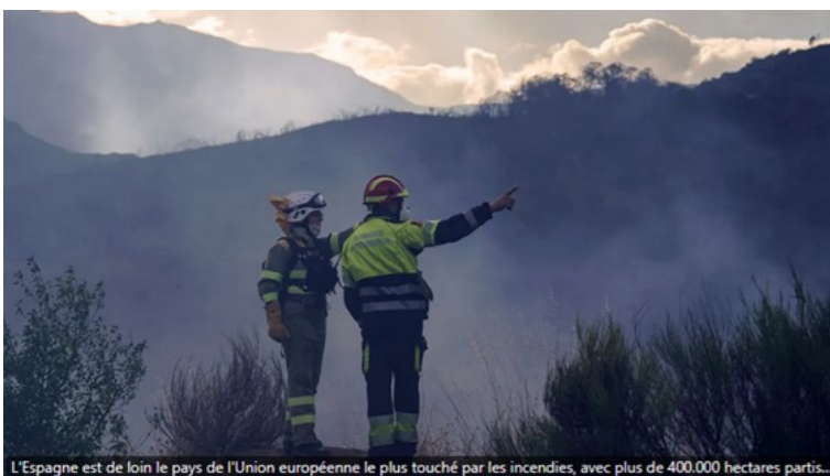
L'Espagne est de loin le pays de l'Union européenne le plus touché par les incendies, avec plus de 400.000 hectares partis...

Comme nombre de nos concitoyens sur le territoire du sud Luberon, vous avez choisi de vivre à la campagne, dans une zone boisée. La vie y est agréable, notamment parce que la forêt offre un sentiment de calme et de plénitude. Or, comme vous le savez sûrement, sur la quasi-totalité des régions du sud de la France pèse la menace des feux de forêts. Afin de réduire au mieux ce risque, l'état a mis en place une politique de prévention qui commence par le débroussaillage autour des habitations et de leurs accès. Les obligations légales de débroussaillage (OLD) ont été instaurées par la loi de 1985